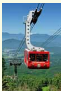
北ハケ岳ロープウェイ