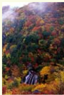
王滝(蓼科中央高原)